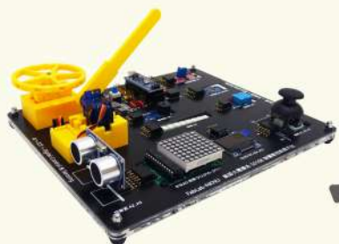
5016B 智慧數控教學平台