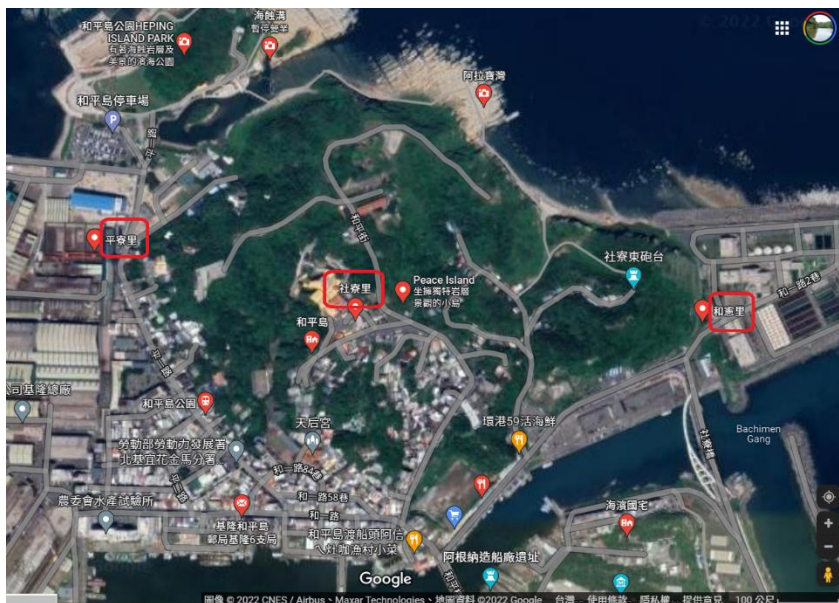
圖 1-2 本校和平島學區：平寮里、社寮里、和憲里。

由圖 1-1 可見，本校位於大片綠色森林之中，周圍乃是基隆最著名的風景：中正公園。此外尚有基隆主普壇、十八羅漢洞、役政公園、海門天險等，自然環境宜人，古蹟文化豐富。外地遊客經常到此遊覽，可惜交通不便，自民國 54 年以來，至今沒有規劃公車路線。