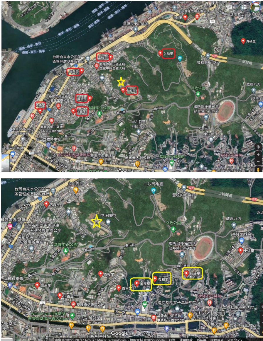
圖 1-1 本校學區內各里位置圖(不含和平島)。黃色星號為本校，紅色框里名為本校學區，色框里名代表只有部分鄰為本校學區。

基隆市立中正國民中學(以下簡稱本校)位於基隆市中正區中船路36巷59號，學區有信義區的信綠里(第15、16、17、21鄰)、義民里(第9鄰)、義和里(第17鄰)等里；以及中正區的信義里、義重里、正義里、港通里、德義里、中船里、入船里、正船里(圖1-1)，及位於和平島的社寮里、和憲里、平寮里(圖1-2)等里。